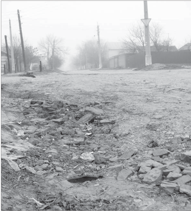
(Окончание. Начало - стр. 1)

У компетентных же органов, ведущих сейчас расследование по факту освоения 81 миллиона, на этот счет, наверняка, назревает мнение полярного свойства.