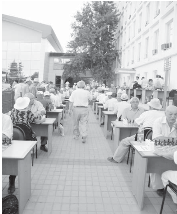
Окончание. Начало - стр. 1

Как-то раз, когда британская команда свой матч завершила, Спилмэн попросил меня раздобыть ему нож. Я, хоть и не без труда, его необычную просьбу удовлетворил, после чего Спилмэн куда-то загадочно ушелся.