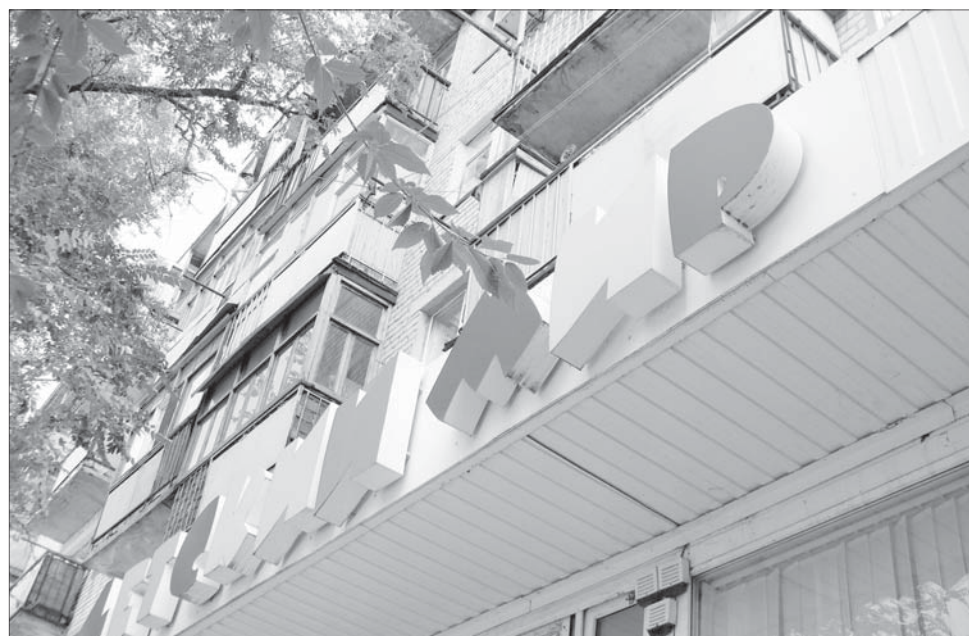
Фото к тексту: таким был 3-й мкр-он в начале своего жизненного пути (верхний снимок); такой стала его западная окраина в наши дни (средний снимок); одна из достопримечательностей 3-го мкр-она – магазин «Детский мир».

Что же касается третьего микрорайона, то в общегородской список домов, требующих капремонта, попали лишь семь его домов (от более «свежего» восьмого микрорайона, почему-то, 20). Видимо, городские власти считают кирпичные многоэтажки микрорайона-3 образцом неприхотливости и долговечности. Так зачем же тогда заводить разговор о его сносе?