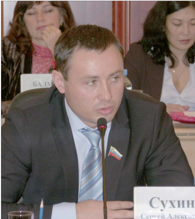
Окончание. Начало - стр. 1

Еще одну вопиющую особенность обнаружили нынешние гордепы: роль их коллег в прежнем созыве была по существу сведена к нулю. Жалеть их, правда, за такую дискриминацию просто смешно. Если снова говорить доходчивым языком, именно прежние депутаты ЭГС молча голосовали за введение в Положение о бюджетном процессе Элисты норм, противоречащих Бюджетному кодексу РФ. Еще проще: депутаты должны были все, что предлагал Бурулов, только одобрять. Без права на какие-либо контрольные функции. Сейчас этой порочной практике, похоже, будет положен конец. В против-