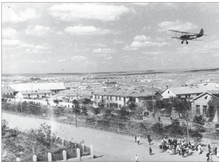
Минувшее погубило безвозвратно...

Немного лиц мне память сохранила, Немного слов доходят до меня,